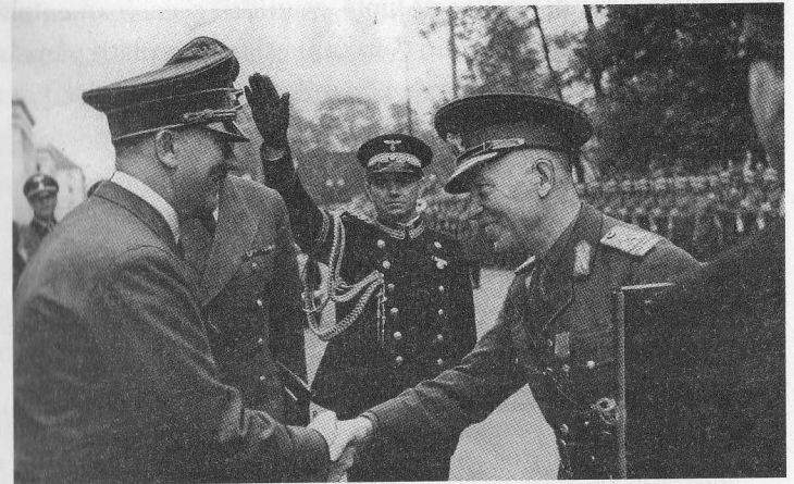
Întâlnirea dintre Adolf Hitler și generalul Ion Antonescu, în cursul căreia s-a discutat despre participarea armatei române la operațiunea militară germană „Barbarossa“ – invadarea Uniunii Sovietice (München, 12 iunie 1941).

Ulterior, presiunile economice germane asupra autorităților de la București s-au accentuat și, după rapturile teritoriale din vara anului 1940, România a intrat complet în sfera de influență germană. La 4 decembrie 1940, a fost semnat la Berlin un acord de colaborare între cele două state, în scopul creșterii masive a exporturilor românești de petrol, produse agricole și forestiere către Germania și a importurilor de armament, muniții, tehnică de luptă și echipamente militare germane necesare armatei române.